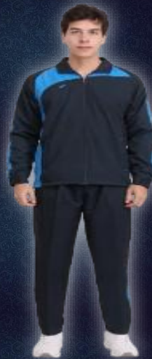
DRESS CODE - COACH