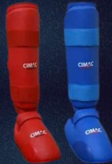
SHIN & FOOT PROTECTOR