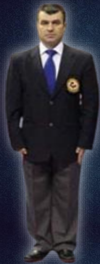
GLOBAL UNIFORM REFEREE